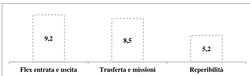
Grafico1: Istituti dell'orario di lavoro(%)