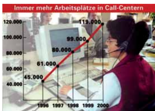
Aumentano i lavori nei call centre in Germania

Gli esperti hanno evidenziato in modo particolare i rischi multifattoriali. La letteratura settoriale si concentra sui call centre. L'aumento di questi ultimi ha portato all'introduzione di nuovi tipi di lavoro soggetti ad esposizione multipla, vale a dire: prolungata posizione seduta, rumore di fondo, cuffie inadeguate, basso livello di ergonomia, scarso controllo del lavoro, pressione elevata sui tempi di lavoro nonché pressione mentale ed emotiva. DMS, vene varicose, disturbi del naso e della gola, disturbi vocali, affaticamento, stress e sindrome del burnout sono stati riscontrati tra gli operatori dei call centre.